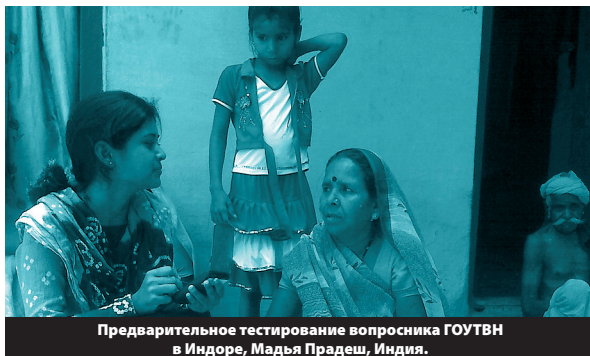
Предварительное тестирование вопросника ГОУТВН в Индоре, Мадья Прадеш, Индия.