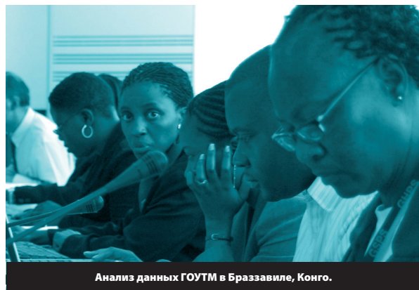
Анализ данных ГОУТМ в Браззавиле, Конго.

Унифицированные вопросы и показатели эпиднадзора имеют жизненно важное значение. Необходимо координировать работу с партнерами по борьбе против табака, с тем чтобы при разработке обследований использовались одинаковые критерии. Ключевые показатели включаются в Глобальное обследование употребления табака взрослым населением (ГОУТВН), являющимся репрезентативным в национальном плане обследованием домашних хозяйств, данные из которого поступают в Глобальную систему эпиднадзора за табаком. Глобальное обследование употребления табака молодежью (ГОУТМ) проводится в школах. В нем принимают участие учащиеся в возрасте от 13 до 15 лет. Данные этого обследования также включаются в Глобальную систему эпиднадзора за табаком.