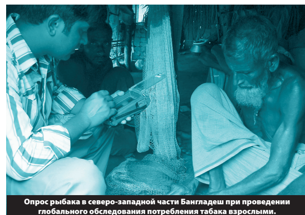
Опрос рыбака в северо-западной части Бангладеш при проведении глобального обследования потребления табака взрослыми.

В этих условиях могут привлекаться партнеры по проведению обследований, обладающие достаточными техническими возможностями. К таким партнерам относятся национальные статистические бюро, университеты и частные исследовательские фирмы. Эти партнеры могут оказать поддержку в мониторинге, в том числе в проведении обследований, а также в сборе, обработке и анализе данных.