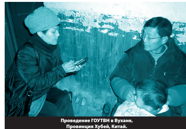
Проведение ГОУТВН в Вухане, Провинция Хубей, Китай.

ГОУТВН может использоваться в качестве основы для сбора данных, сопоставимых в международном плане