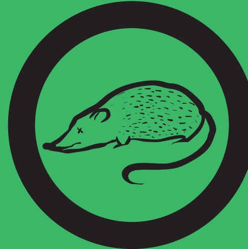
Ацетон Щурича отрута