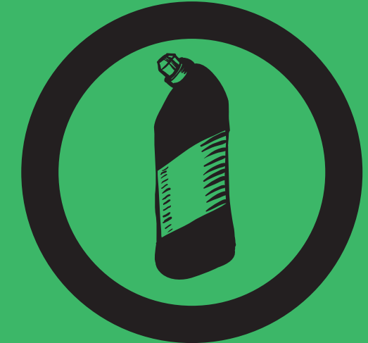
Аміак Туалетний очищувач