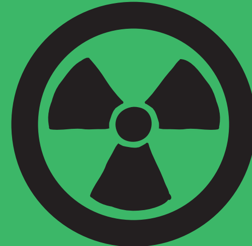
Радон Радіоактивний газ