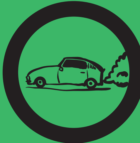
Окис вуглецю Вихлопні гази