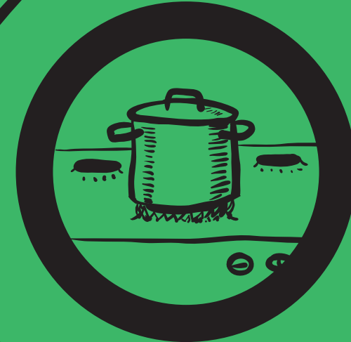
Метан Туалетний газ